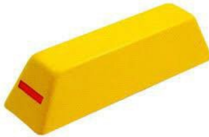
Figura Ilustrativa para Referência

(460mmx120mmx170mm), Refletivo com Pino de Fixação.