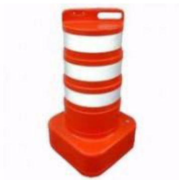
Figura Ilustrativa para Referência