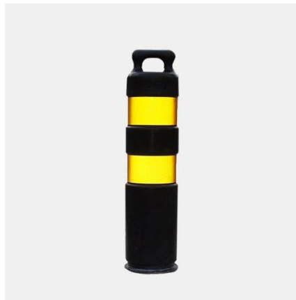
Figura Ilustrativa para Referência

Para uso permanente, pino de fixação direta no solo, ultra flexível e resistente a impactos. Corpo preto, faixas refletivas amarelas, autoadesivas (largura 150mm) norma NBR. 14.644. MEDIDAS: 80cm X 19 diâmetro. MATERIAL: POLIURETANO.