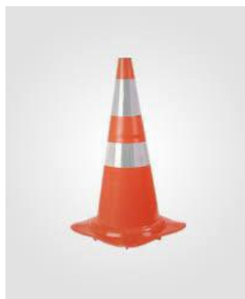
Figura Ilustrativa para Referência

Dimensões dos cones de sinalização: Altura 75cm, base 40 x 40 cm, possuir 08 sapatas.