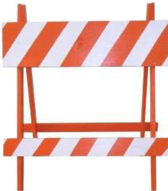
Figura Ilustrativa para Referência

Obs: Os materiais serão entregues pela contratada, com a gravação em pintura resistente, no caso dos cones e barril, deverá ser aplicado adesivo refletivo com o logo da Diretoria de Trânsito, com película protetora, com resistência às intempéries, conforme a orientação a ser fornecida pela Diretoria de Trânsito e Mobilidade Urbana.